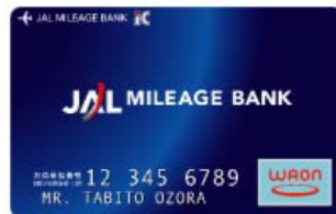
< JMB WAON >