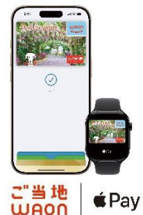
<Apple Pay の WAON>

イオンは、2009年より日本各地の自治体との連携のもと、利用金額の一部が地域社会への貢献につながる「ご当地WAON」の発行を行っています。